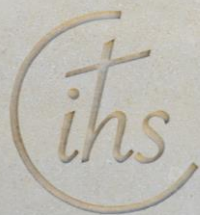
Première pierre du collège Loyola